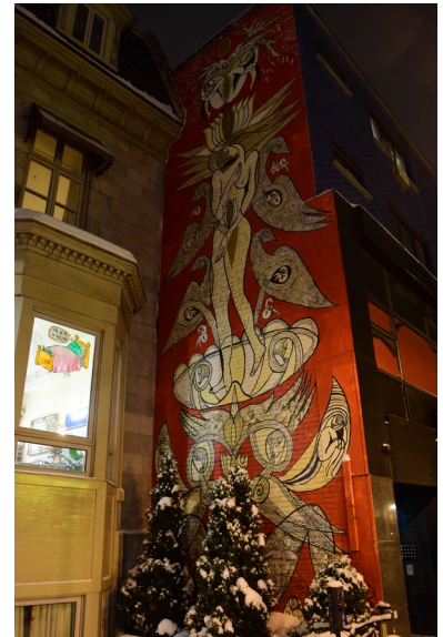
Montréal ist voller Street Art

Viele Studierende wohnen in Uni-Nähe in Côte-des-Neiges. Das ist ein nettes, ruhiges Viertel, aber man eher etwas außerhalb. Wirklich im „hippen“ Viertel wohnt man in Plateau-Montroyal. Allerdings braucht man dann auch circa eine halbe Stunde zur Uni und die Mieten sind dort tendenziell teurer. Ich würde Mile-End/Little Italy/Jean-Talon für UdeM-Studierende empfehlen. Damit ist man näher an der Uni, aber auch in einem Viertel, in dem immer mehr coole Kneipen und Läden aufmachen und das noch nicht ganz so gentrifiziert und teuer ist wie das Plateau. Alles im Bereich Downtown ist von der Lage eher ungünstig und auch nicht wirklich schön was die Kneipen-/Cafékultur und die generelle Wohnatmosphäre angeht (und zudem unfassbar teuer). Man sollte auf jeden Fall auf eine Anbindung an die öffentlichen Verkehrsmittel achten, am idealsten ist es nahe der orangenen oder blauen Metrolinie zu wohnen.