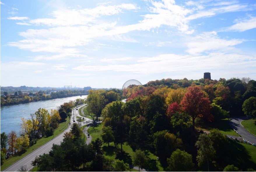
Montréal Mitte/Ende Oktober, wenn die Blätter bunt werden