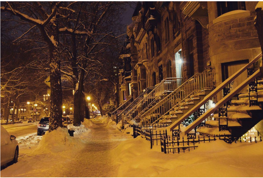
Typische Montréaler Häuser

ohne Fenster (relativ verbreitet in Montréal) oder die Wohnung befindet sich besonders weit außerhalb. Es kommt natürlich auf das Budget an, aber da die Mieten nicht sonderlich hoch sind, finde ich, dass es sich schon lohnt, nach einem zentral gelegenen Zimmer zu suchen.