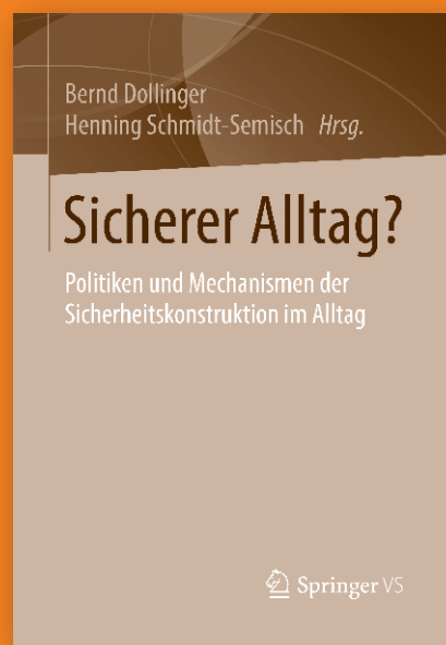
Bernd Dollinger, Henning Schmidt-Semisch, Hrsg., Springer VS

Die Beiträge des Bandes greifen diese Zusammenhänge für unterschiedliche Bereiche des Alltags auf. Mit Beiträgen von H Schmidt-Semisch, M. Urban, F. Schorb u.a.